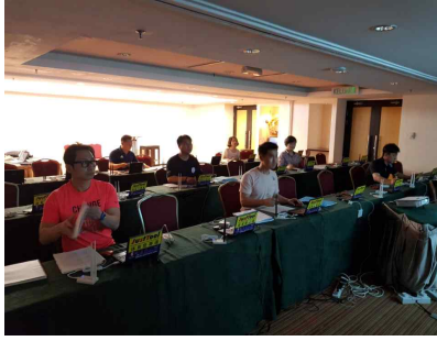
영상 감독 시험