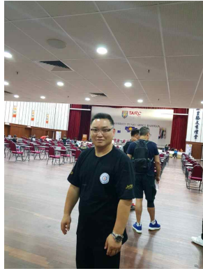
이론 시험 끝나고