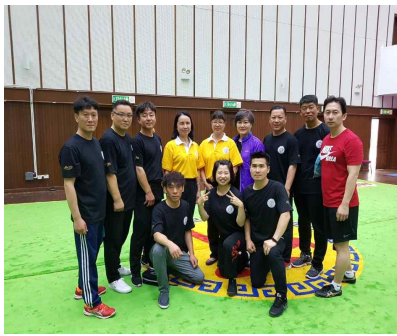
한국 투로 심판들과 강사