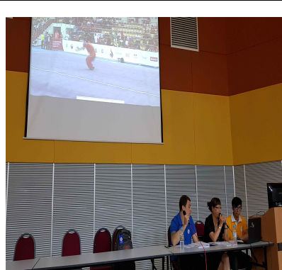
A조 이론 및 영상교육