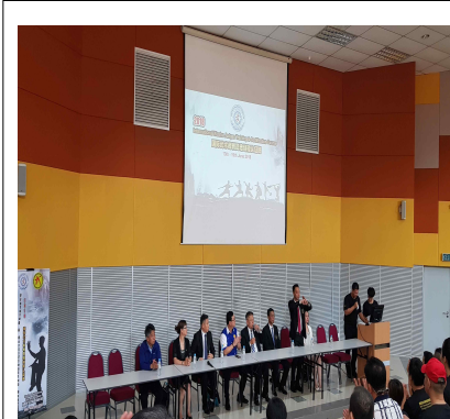
개회식 임원 및 강사소개