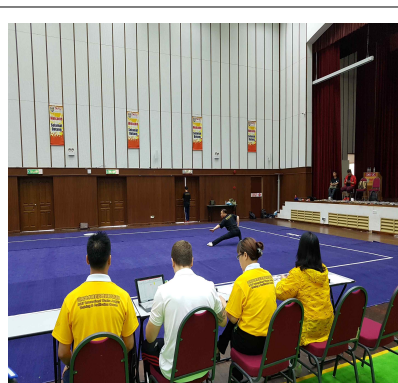
투로 장권 실기시험